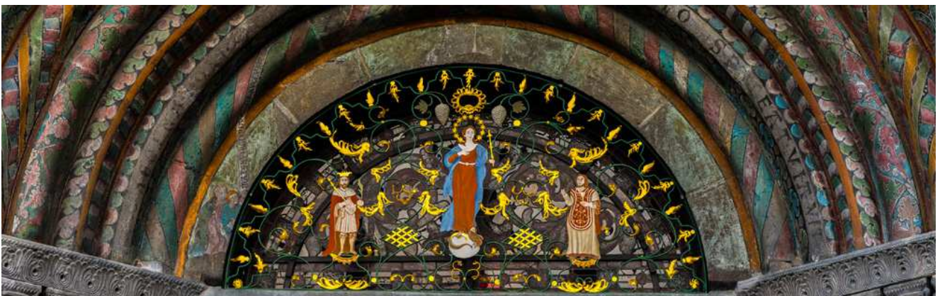
Sakralbau aus dem 12./13. Jahrhundert

https://reiseziele.ch/chur-ein-rundgang-durch-die-aelteste-stadt-der-schweiz/