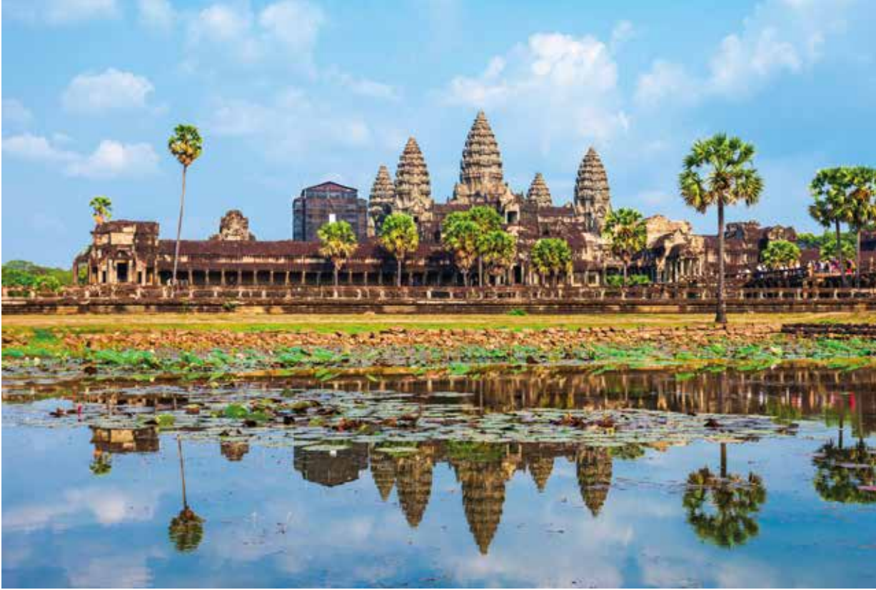
Tempelanlage Ankor Wat