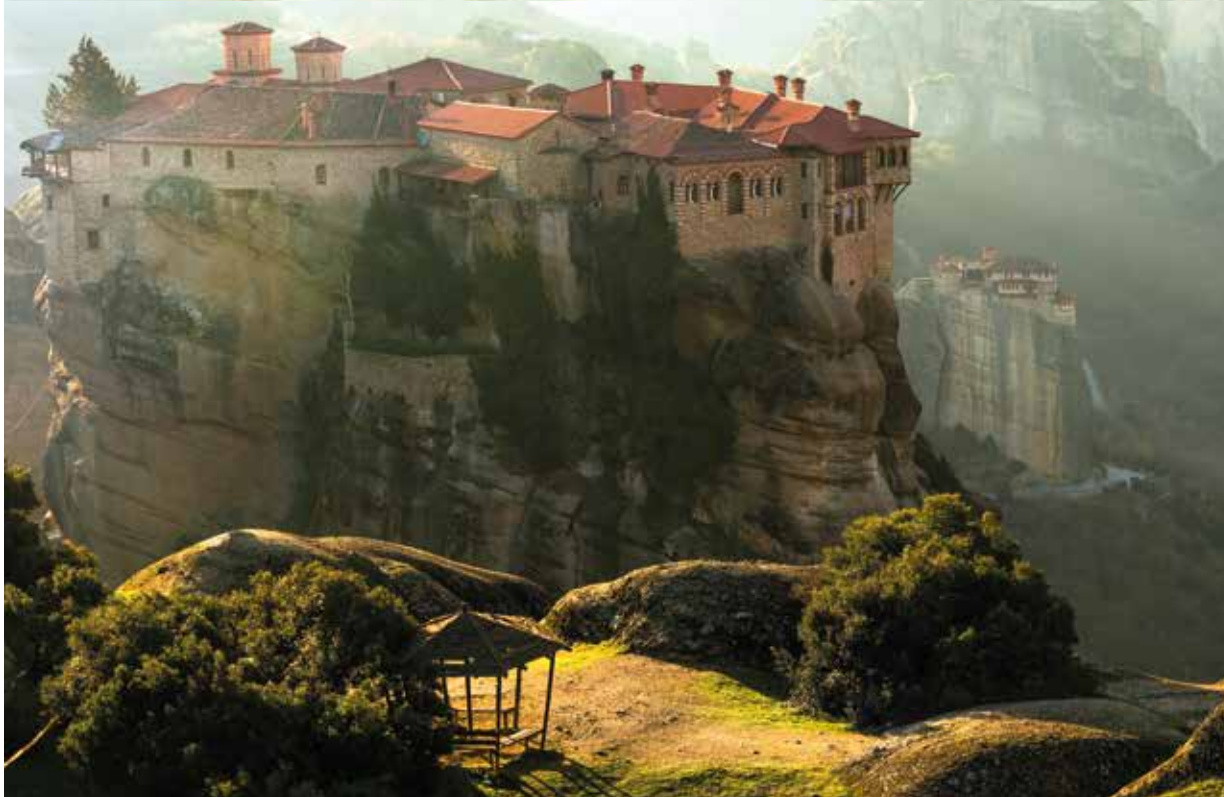
Niklaus Popp geht in den Meteoraklöstern auf den Spuren von Paulus.