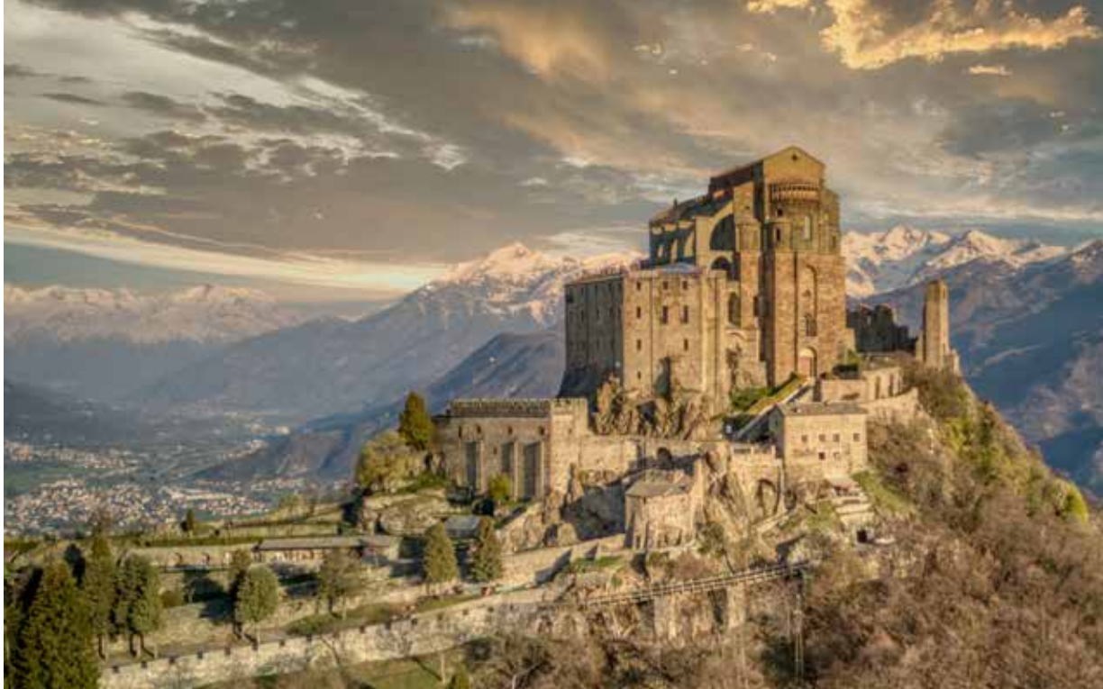
ehemalige Benediktinerabtei Sacra di San Michele in der norditalienischen Region Piemont