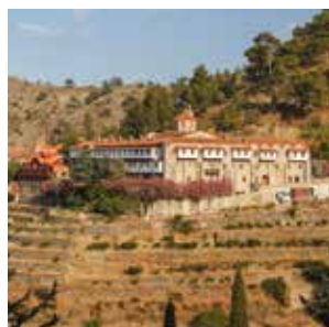
Das Kloster Machairas, das wir besuchen werden.