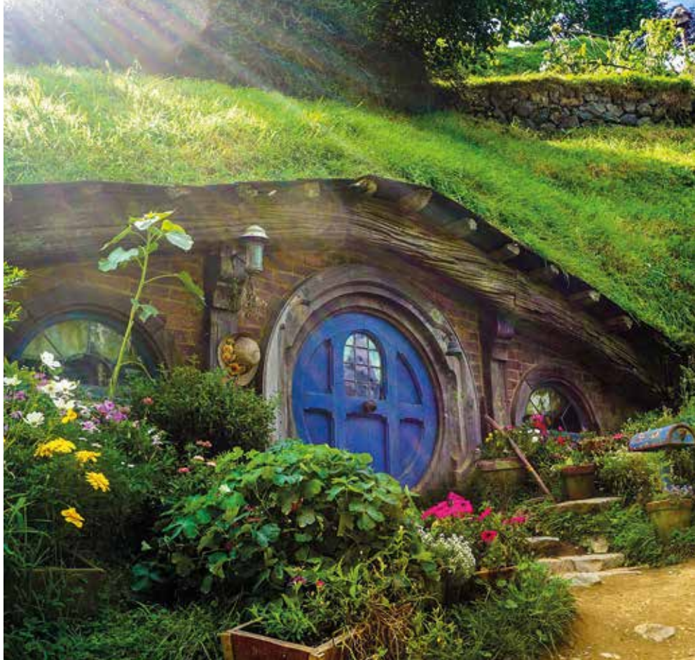
Das Hobbit-Haus in den Filmen «Der Hobbit» und «Herr der Ringe» steht in Neuseeland.